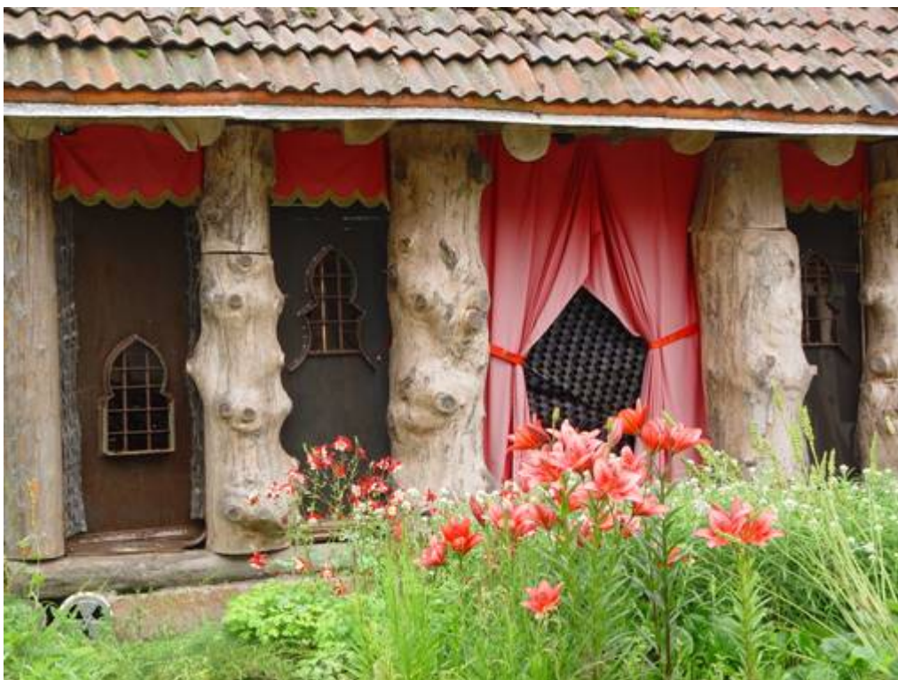
Mekaaninen teatteri (ovet vanhoja hetekoita)

Kokonaan valmistuttuaan toimii myös ilman näyttelijöitä mekaanisesti, paineilmalla jne. Yleisö katsoo esitystä kadulta.