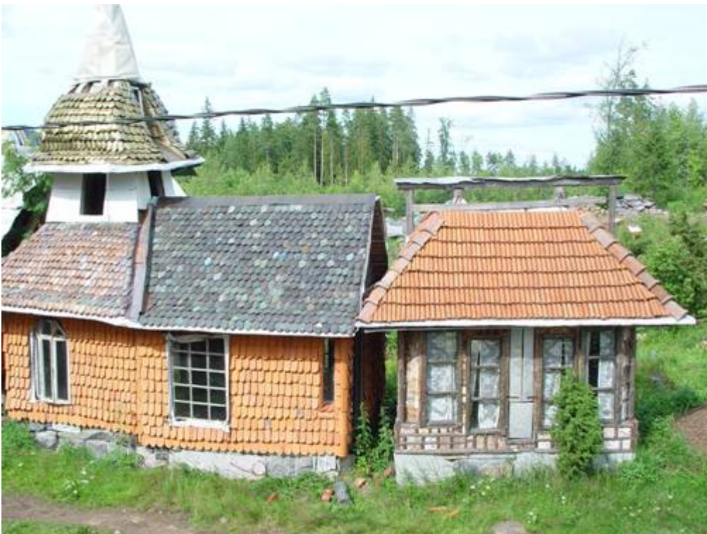
Hääkirkko ja kioski

Ko. teos on parhaillaan tekeillä ja sen on tarkoitus valmistua kokonaan avajaisiin mennessä. Pelimannimäen teokset ovat toimivia ja ne usein edellyttävät katsojan aktiivista osallistumista, joka syventää kokemusta.