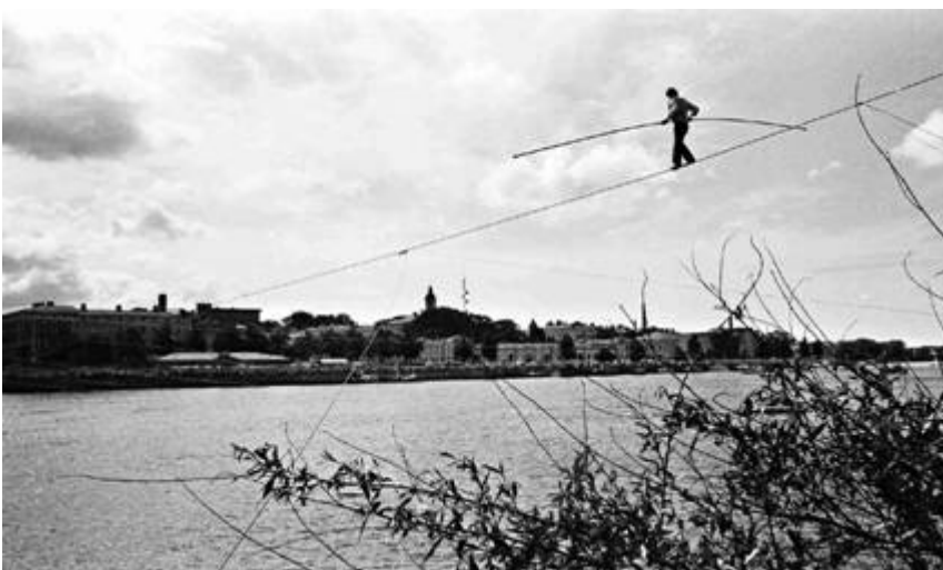
Kokemäenjoen ylitys, © Pekka Ovaska