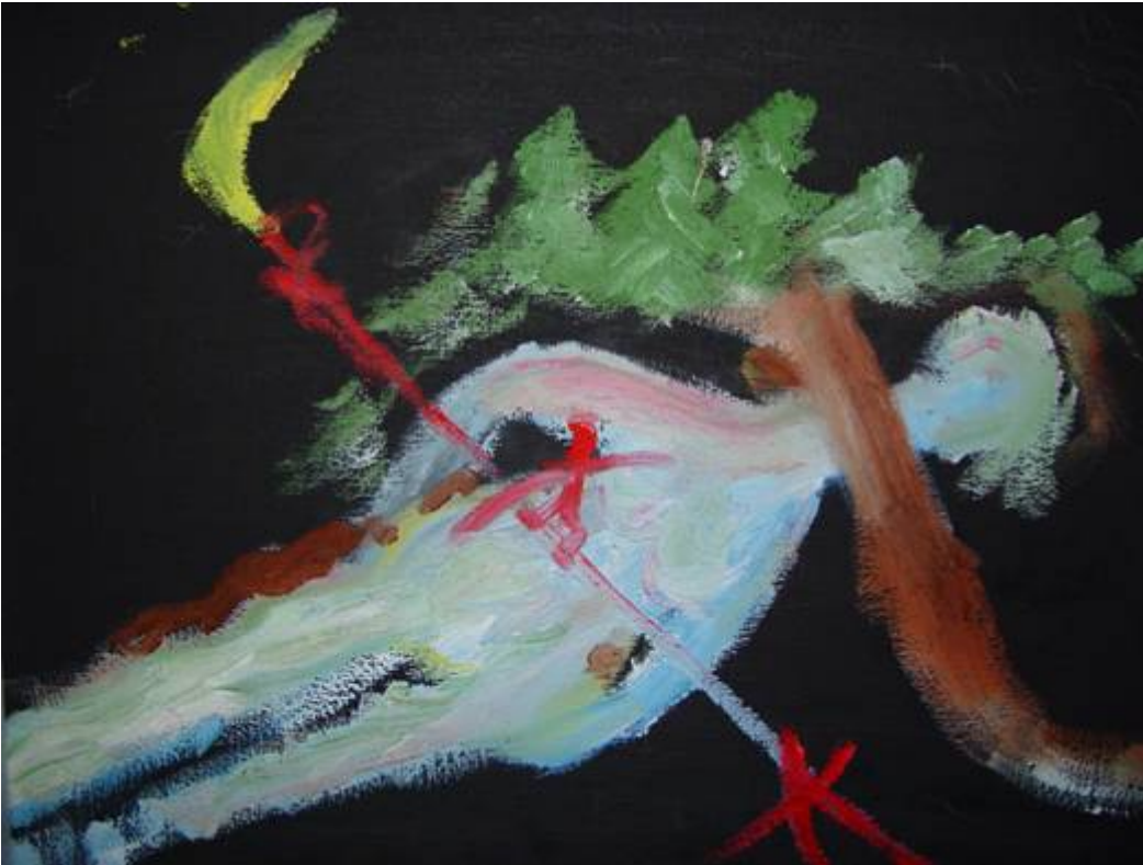
Imatrankosken yllä nuoralla selällään maaten maalattu "Koskinäkymä", öljy.