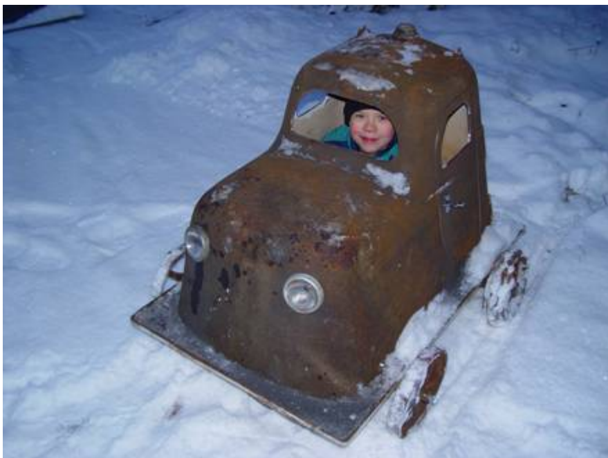
(Niila-Tinka ajoi tähän valurautaisella istumakylpyammeella.)

savitiliä. Monet teokset ovat osittain keskeneräisiä. Kioskin katto salaojaputkesta (savea), seinissä tuhta ja messinkiä.