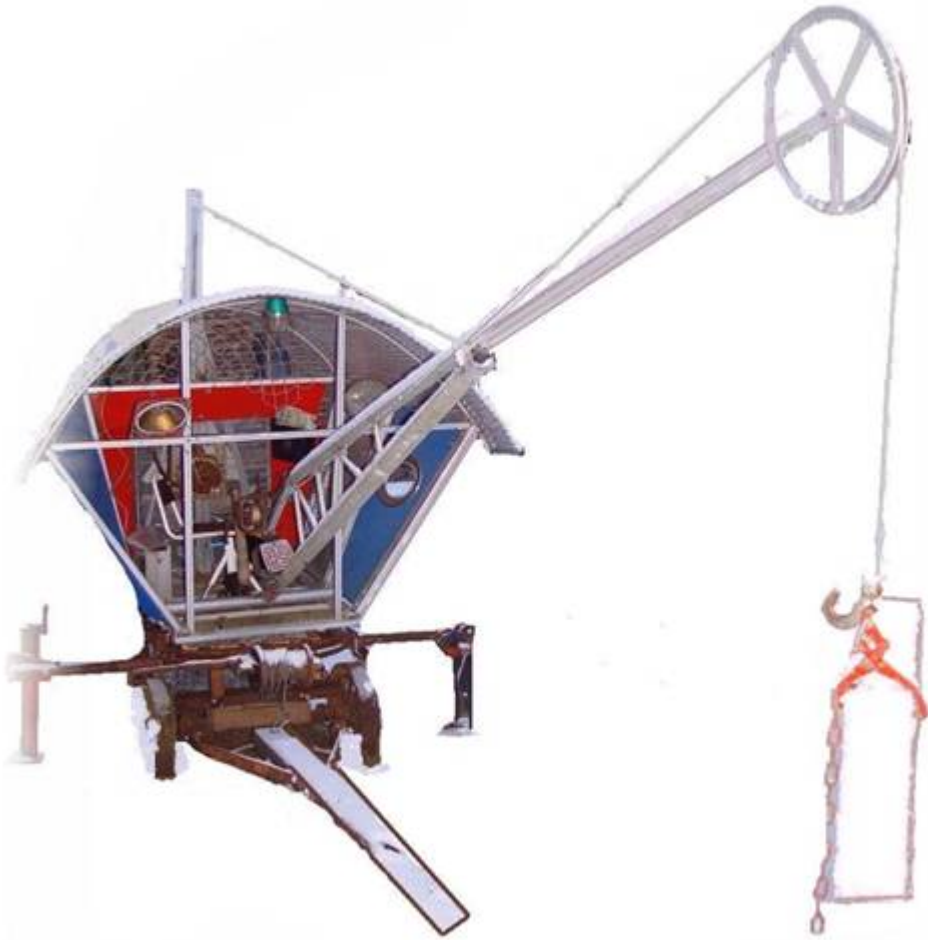
Anker- nosturi Laite leikattu irti taustasta.